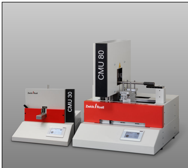
Stand-alone Querschnittsmessgeräte CMU30 und CMU80