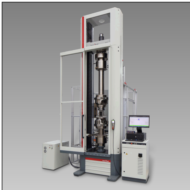
Z600E – Prüfung an Faserverbundwerkstoffen